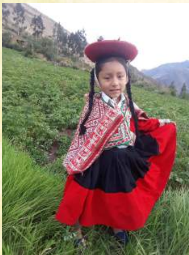
Nieble Comunidad de Kishuarani-