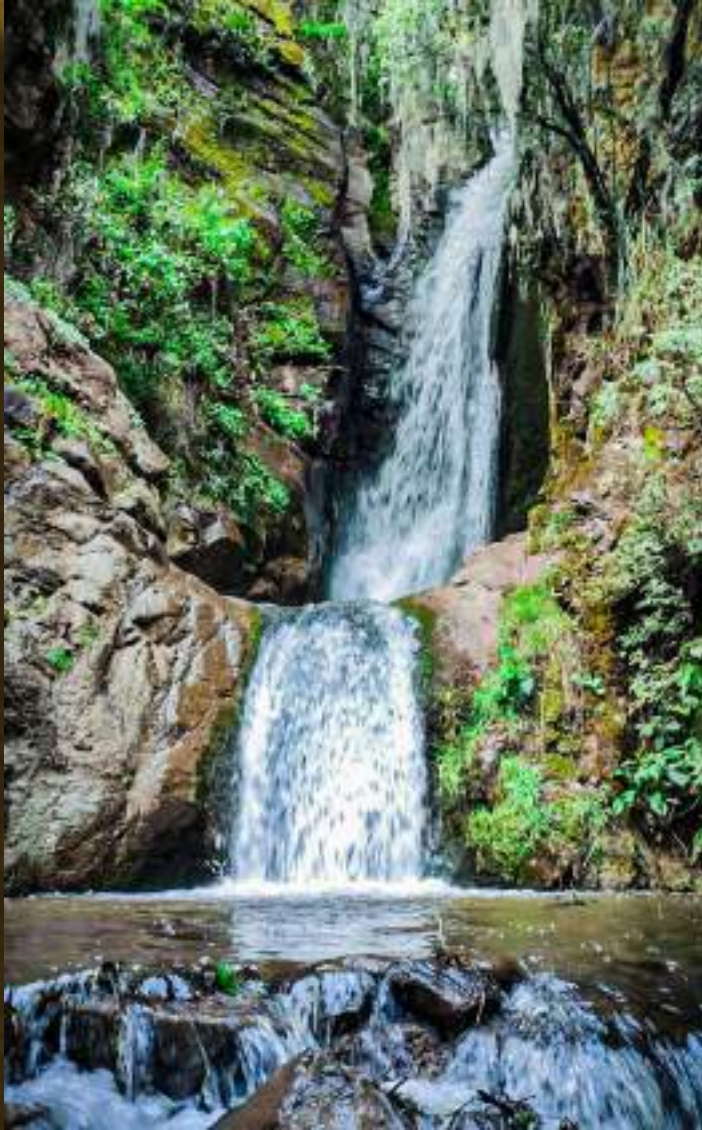
Deivi Mendoza - Cataratas Sirenachayoc