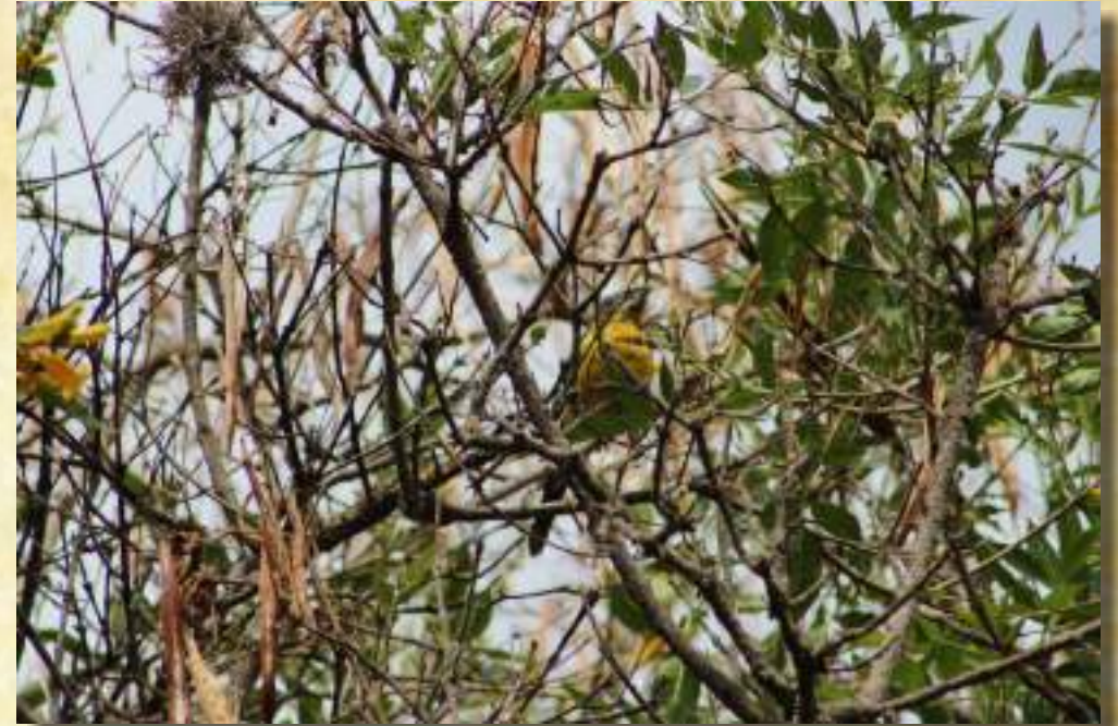
Pico Grueso de Dorso Negro (Pheucticus Aureoventris)