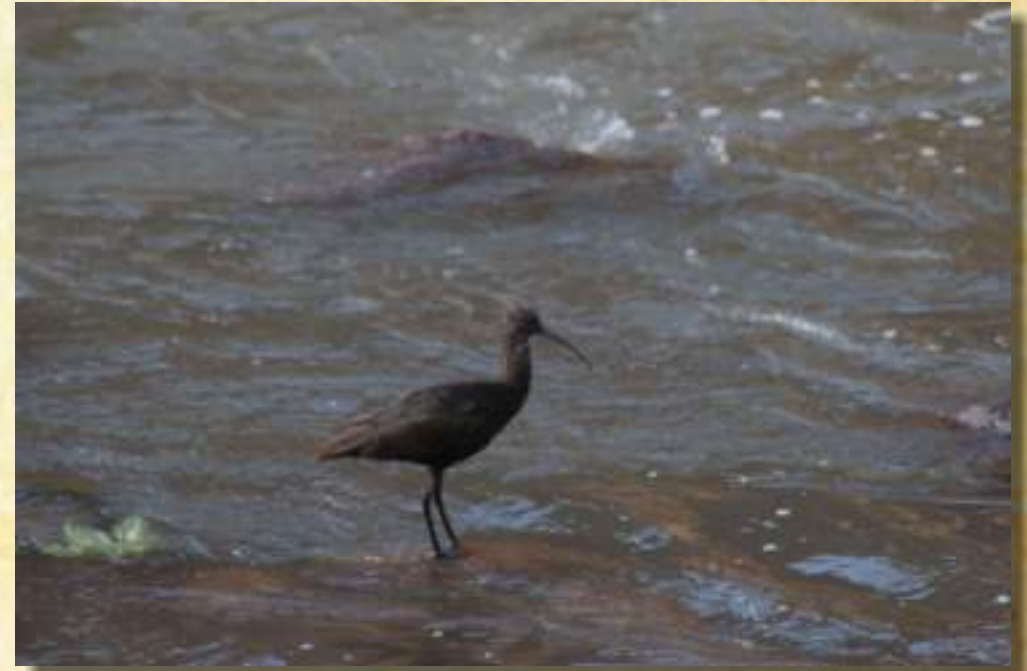
Ibis de Puna (Plegadis Ridgwayi)