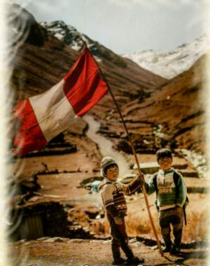
Ninos de la Comunidad Phusa - Calca

Por tanto es de vital importancia promover dichas actividades y difundir su correspondiente práctica desde la oficina EDUCACIÓN, CULTURA, DEPORTE Y JUVENTUDES, la cual está comprometida a promover este tipo de eventos y actividades así mismo incentivar a la población la participación de dichas actividades, generando buenas prácticas y hábitos históricos.