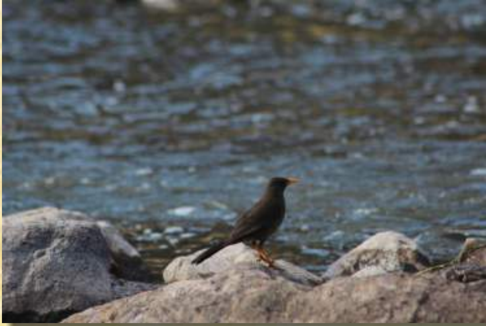
Zorzal Chiguanco (Turdus Chiguanco)