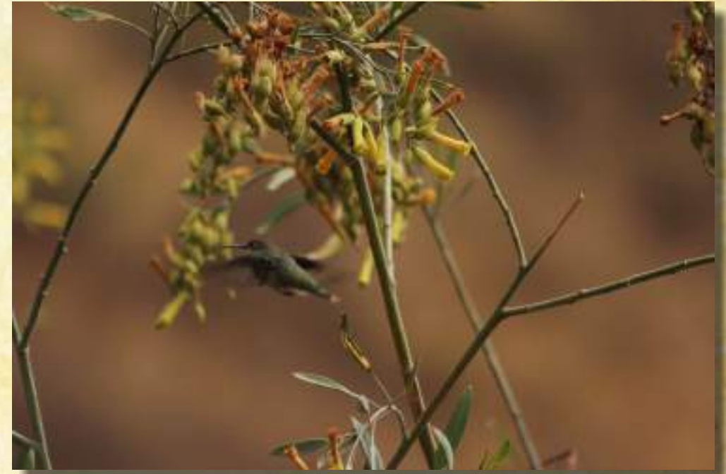
Colibrí de Cola Larga Verde (Lesbia Nuna)