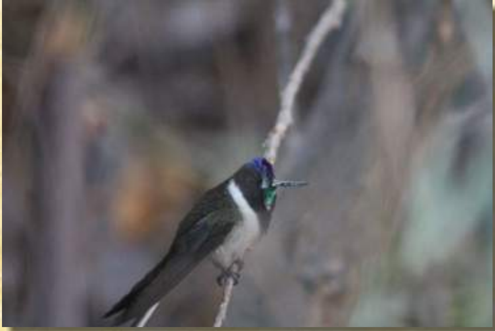
Mostañez Barbudo (Oreonympha Nobilis).