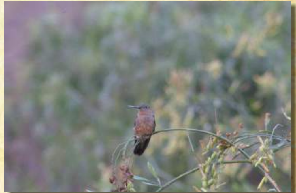
Colibrí Gigante Patagónica (Cigas).