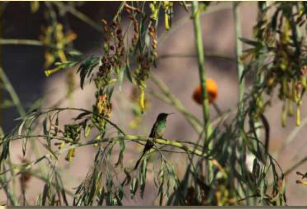
Colibrí de Cola Larga Verde (Lesbia Nuna)