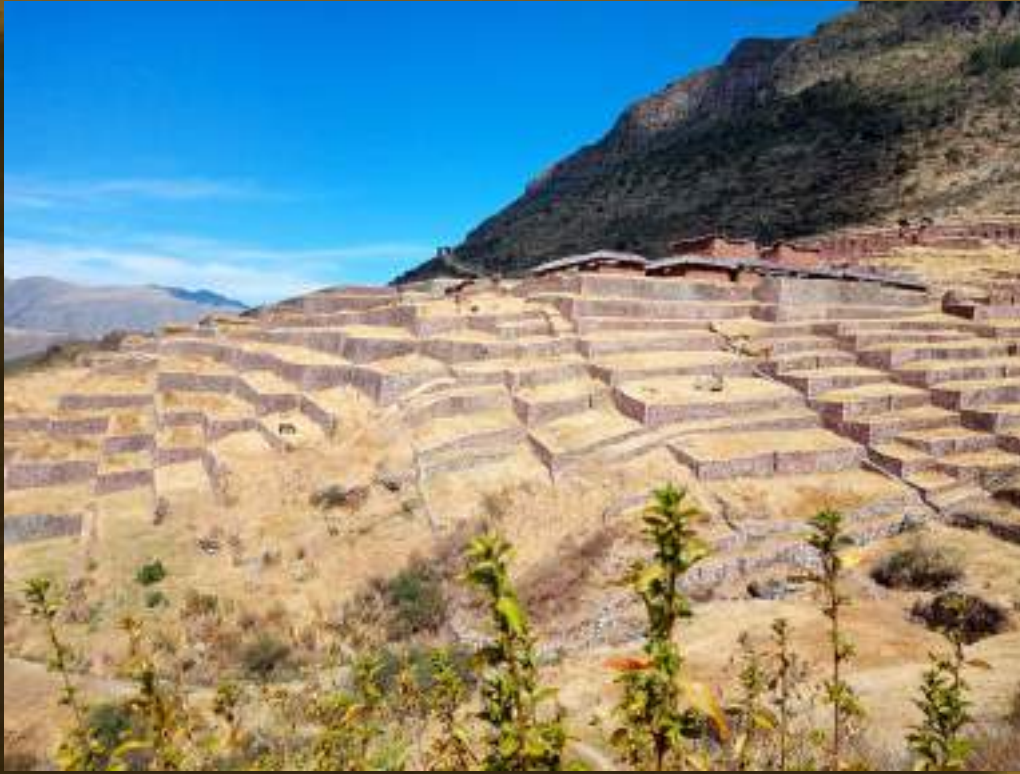
Sorayda Santi – Uchuuy Qosqo