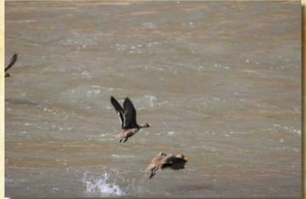
Pareja de Patos Barcinos (Anas Flavirostris) en Vuelo.