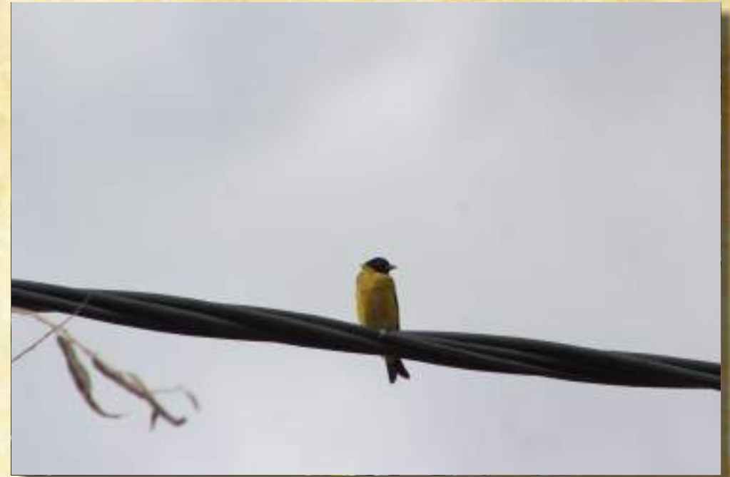
Tilgero Encapuchado (Carduelis Magellanica)