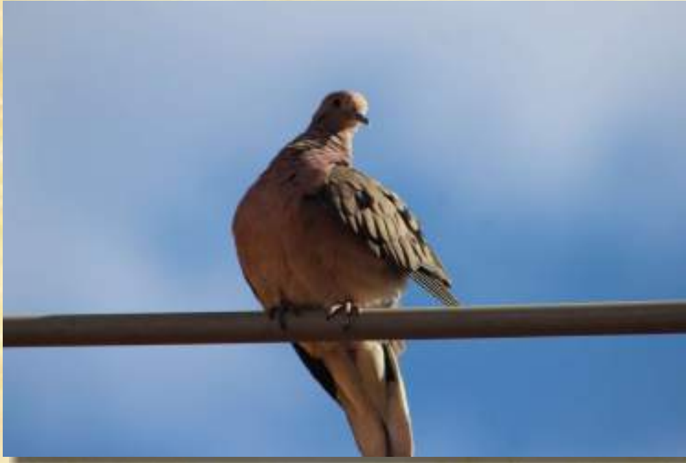
Tortola Orejuda (Zenaida Auriculata)