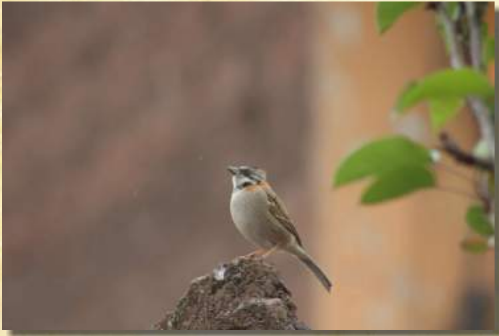
Corrión de Cuello Rufo (Zonotricha Capensis)