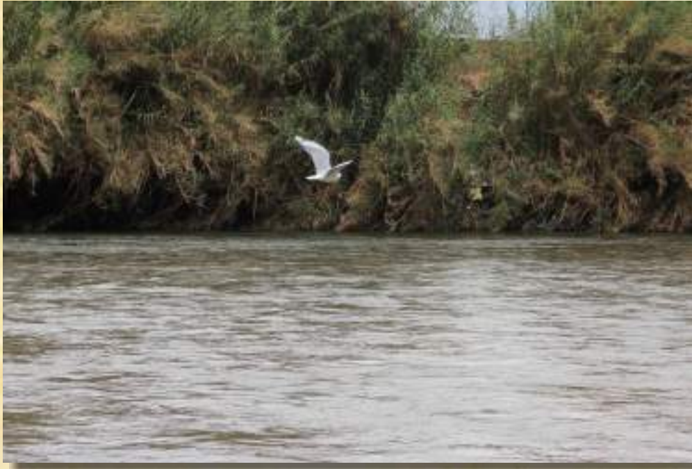
Caviota Andina (Chroicocephalus Serranus)