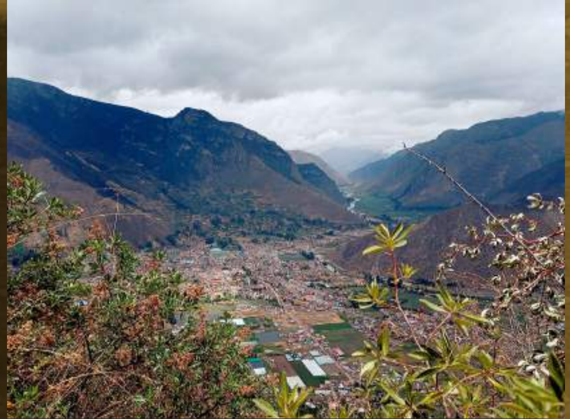
Soraya Santi - Calca desde Unuraqui